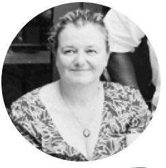
Marie Réty Solidarité Accueil