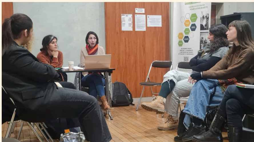
Groupes d'échanges durant la Journée Régionale du 12 décembre 2024 à Besançon