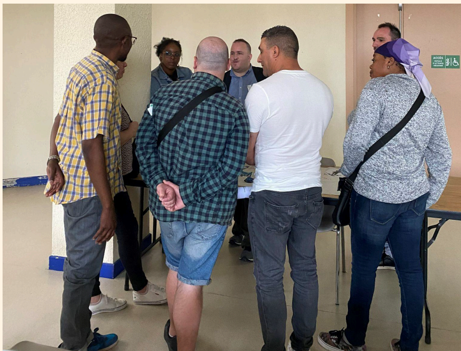
Plénière sur l'insertion par l'activité économique à Belfort, le 5 juillet

Le CRPA de Bourgogne-Franche-Comté a œuvré pour améliorer la vie des personnes en situation de précarité. À travers diverses plénières et groupes de travail, les délégué-es ont abordé des sujets cruciaux comme les addictions, l'insertion par l'activité économique et l'accès aux droits. Des collaborations fructueuses avec des institutions locales et des formations ciblées ont permis de renforcer les compétences des délégué-es et d'amplifier leur impact. Le CRPA a ainsi joué un rôle clé dans la défense des droits et l'amélioration des conditions de vie des personnes accompagnées.