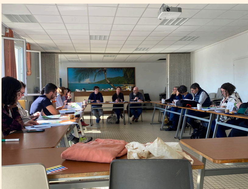
Journée feuille de route à Chenôve, le 28 mars