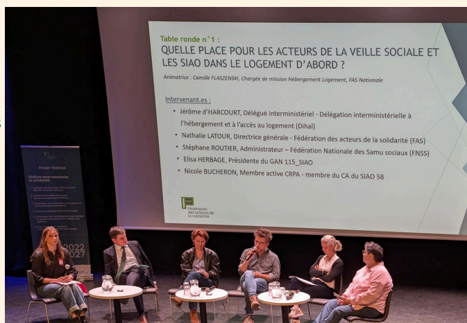
Journée nationale Logement d'Abord, le 20 mai

Un travail autour de l'attractivité et les missions des métiers du travail social dans le dispositif national d'accueil sera proposé à la commission AHI-DNA.