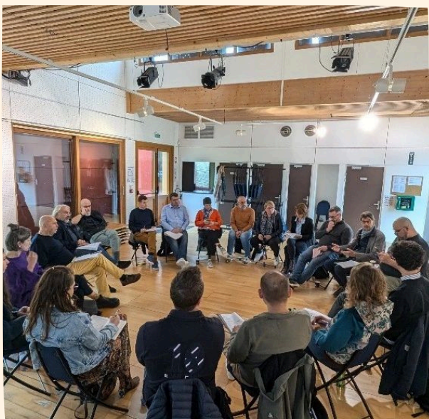
Journée d'étude sur le modèle économique des ACI à Chenôve, 1er octobre