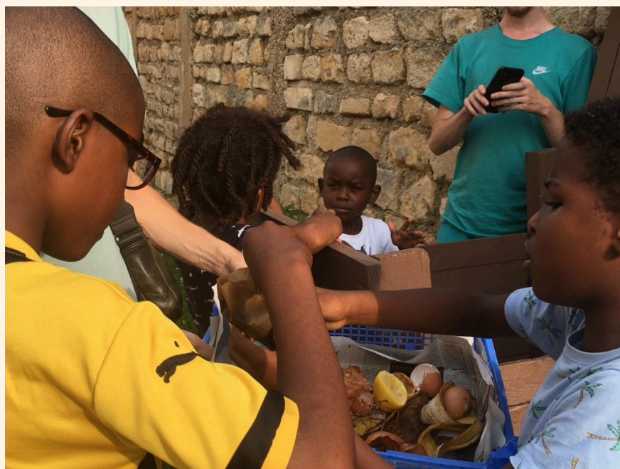
Projet "Trions, créons, respirons" à la résidence Coallia d'Auxerre, durant l'été