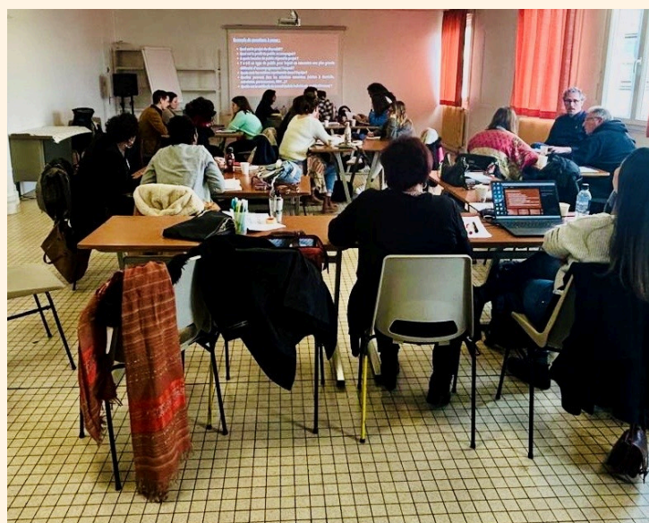
Formation à l'intégration des travailleurs pairs à Chenôve, le 6 février

La formation RESPAI continuera et nous accompagnerons les professionnels sur la question de l'intégration des travailleurs pairs dans les équipes. Nous intervenons également comme prestataire pour le CREA BFC dans une sensibilisation à l'intervention pair.