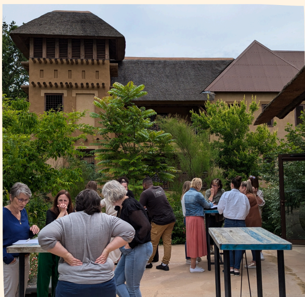
Journée AURA/BFC Parc le Pal 18 juin