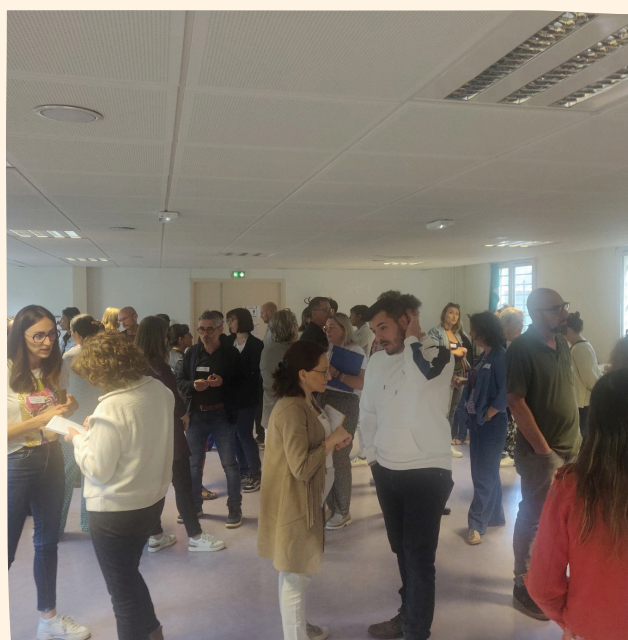
Journée du cycle des rendez-vous CIP/ASP/Encadrants techniques à Besançon, 2 juillet