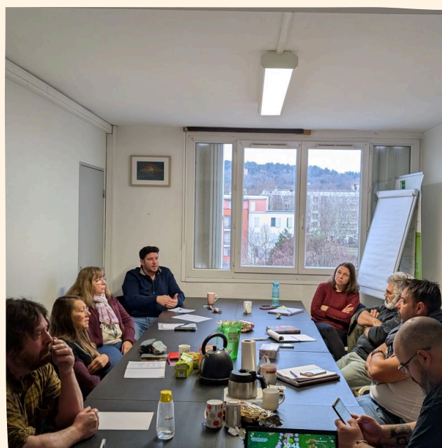
Groupe d'échange de pratiques à la FAS BFC, le 10 décembre

Le programme poursuivra son déploiement en 2025 en intensifiant la communication directe auprès des structures, suivant ainsi la stratégie nationale visant à former 400 SIAE supplémentaires d'ici 2027.