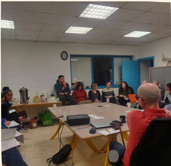
Les cafés partenaires Emploi du Pont à Tournus, le 28 janvier

Enfin, 2025 devrait être une année de refonte pour la formation ETAIE dans notre région afin que la proposition soit plus adaptée aux besoins des structures. Une formation sur la médiation active devrait naître.