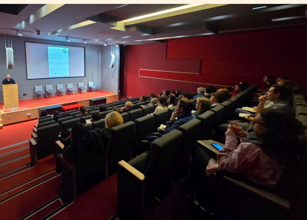
Journée des PASS à Dijon, le 10 mars

De plus, une formation sera élaborée autour de la précarité et du vieillissement.