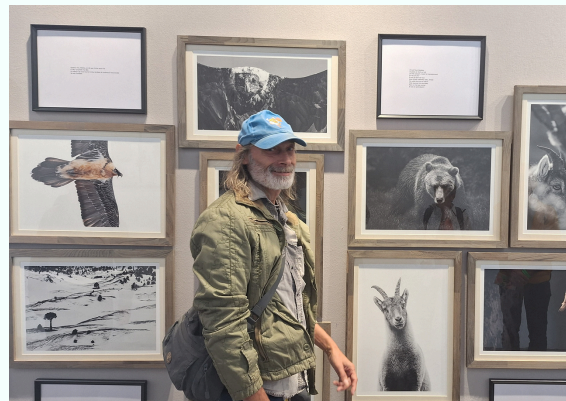
Association SOLIHA - Drôme