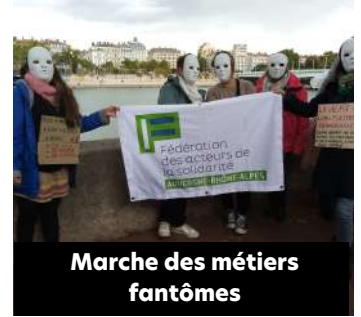
Marche des métiers fantômes